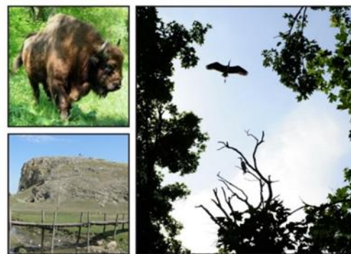
Prutul de mijloc

Complexitatea traseului: deplasare cu transport. Nu există grad sporit de complexitate, dar pentru vizitarea obiectivelor turistice se vor parcurge distanțe semnificative pe jos.