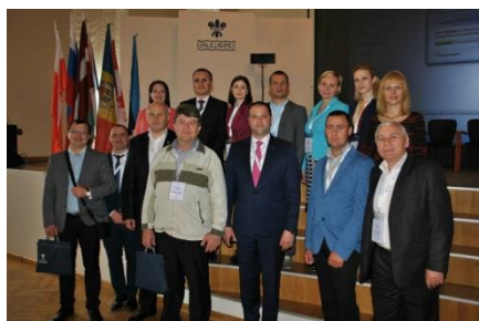
Forumul Internațional de Business Est-Baltic din Daugavpils, Letonia

În rezultatul facilitării semnării în anul 2013 a acordului de colaborare dintre Primăria Corjeuți, r-l Briceni și municipalitatea Alojja din Letonia, în perioada 13-20 mai 2014, un grup format din reprezentanți ai APL din RDN, antreprenori, reprezentanți ai MDRC, ADR Nord, ONG în număr total de 20 de persoane, au participat în cadrul vizitei de studiu în Letonia, inclusiv la Forumul