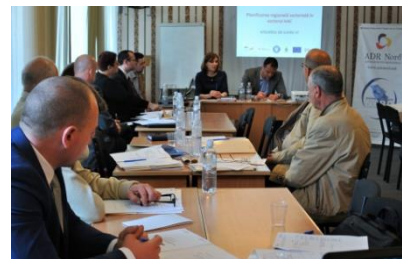
Ședința GLR pentru AAC din RDN