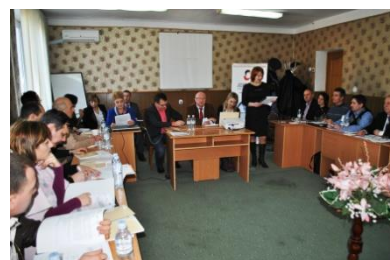
Ședința GLR pe proiect MDS, Z2 din RDN