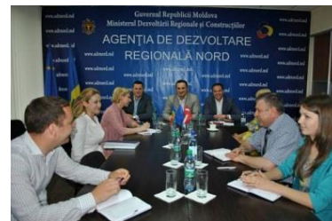
Vizita Ministrului Leton, Romāns Naudiņš

✚ Ministrul Protecției Mediului și Dezvoltării Regionale al Letoniei, Romāns Naudiņš , a vizitat Agenția în contextul participării la cea de-a IV-a ediție a Conferinței de cooperare internațională cu genericul „Depășirea disparităților regionale”, ce a avut loc la Chișinău în perioada 21-22 mai curent. Oficialul leton s-a interesat de atuurile economice ale raioanelor din RDN, menționînd că orice localitate, orice raion are acel specific local, acele particularități economice și turistice ce, odată valorificate, pot impulsiona dezvoltarea locală și regională.