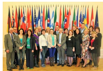
Cursul de instruire organizat în cadrul proiectului „Creșterea capacităților administrației publice”, locale de amenajare a teritoriului și municipalităților”, Paris

1. Franța, Paris. În perioada 19-20 martie 2014, 3 specialiști ADR Nord au participat la Cursul de instruire organizat în cadrul proiectului „Creșterea capacităților administrației publice locale de amenajare a teritoriului și municipalităților”, finanțat prin intermediul Instrumentului financiar norvegian, ce s-a desfășurat în or. Paris, Franța. Cursul de instruire s-a axat pe subiecte precum dezvoltarea economică locală, instrumentele de dezvoltare locală, monitorizarea și evaluarea dezvoltării locale, conform unei baze de date eficiente, și modalitatea de comunicare dintre autoritățile locale și reprezentanții sectorului privat. În acest sens, experții au adus drept exemple de dezvoltare mai multe localități din Marea Britanie, Polonia și Irlanda. În concluzie menționăm faptul că problemele de dezvoltare regională din Moldova și Letonia sunt asemănătoare, iar experiența în acest domeniu a unor state din Uniunea Europeană poate servi exemplu pentru regiunile de dezvoltare din țara noastră.