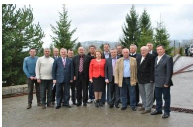
România, Ceahlău, Piatra-Neamț

2. România, Ceahlău, Piatra-Neamț. La 15-16 aprilie, vizită de studiu pentru participare la atelierul de lucru „Identificarea soluțiilor și domeniilor de cooperare între două regiuni de dezvoltare: ADR Nord-Est din România și ADR Nord din Republica Moldova”. La eveniment au participat 3 reprezentanți ai ADR Nord și 6 membri ai CRD Nord.