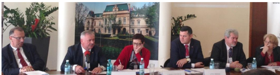
Cooperarea transnațională România - Republica Moldova - Ucraina în cadrul Strategiei UE pentru regiunea Dunării”

3. România, Iași. La 25 aprilie 2014 RDN a participat la reuniunea cu genericul „Cooperarea transnațională România - Republica Moldova - Ucraina în cadrul Strategiei UE pentru regiunea Dunării”. Regiunea de Dezvoltare Nord a fost reprezentată la eveniment de către președintele RDN, directorul Agenției de Dezvoltare Regională Nord și 5 membri ai CRD Nord. În cadrul reuniunii s-a discutat despre importanța cooperării transnaționale în sprijinul implementării SUERD, despre cooperarea transfrontalieră România - Republica Moldova 2014-2020, precum și despre rolul structurilor de cooperare regională în atragerea fondurilor europene. Prin organizarea acestui eveniment s-a urmărit abordarea modului în care strategia ajută statele riverane să facă față provocărilor actuale comune și să influențeze revitalizarea economiei.