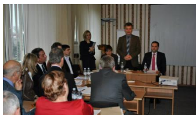
Ședința GLR pentru DLR din RDN