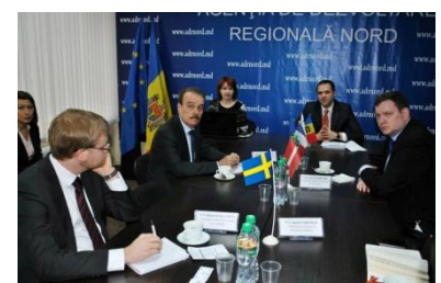
Ambasadorii pentru Parteneriatul Estic