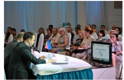
Moldova Business Week

✚ Agenția de Dezvoltare Regională Nord și Filiarele Bălți, Edineț și Soroca a Camerei de Comerț și Industrie în parteneriat cu Ministerul Economiei, Ministerul Dezvoltării Regionale și Construcțiilor au organizat Conferință regională - „Moldova Business Week” cu participarea oamenilor de afaceri din Regiunea de Dezvoltare Nord. Obiectivele conferinței regionale de la Bălți au fost stabilirea necesităților concrete de investiții, trasarea perspectivelor de atragere a investițiilor în RDN, prezentarea în detaliu a prevederilor Acordului de asociere și Zonei de Liber Schimb Aprofundat și Cuprinzător , precum și includerea impactului integrării economice europene pentru mediul de afaceri și cel investițional din Republica Moldova. După conferință, a fost organizată Parcul Industrial „Răut” din orașul Bălți, pentru a cunoaște mai bine potențialul investițional al acestuia.