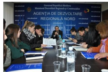
Jurnaliști în vizită de studiu la ADR Nord

Bălți, 2 aprilie 2014. Un grup de 15 jurnaliști de la instituții mass-media naționale și locale au vizitat ADR Nord, unde, cu ocazia evenimentului Ziua ușilor deschise la ADR Nord, au făcut cunoștință cu specificul de lucru al echipei, după care au efectuat vizite la trei proiecte de dezvoltare regională realizate în RDN. „Rezultatele activității noastre pot fi aduse în casele fiecărui cetățean, iar asta mulțumită efortului pe care îl depun jurnaliștii. Pentru că avem ce le spune cetățenilor și pentru ADR Nord este o instituție transparentă, am acordat întotdeauna o atenție sporită relației cu instituțiile mass-media”, susține directorul Ion Bodrug.