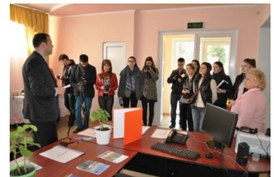
Vizita la Incubatorul de Afaceri Larga

2 aprilie 2014. Un grup de 15 jurnaliști de la instituții mass-media naționale și locale au vizitat 3 localități din RDN unde ADR Nord a realizat proiecte de dezvoltare regională. Vizita de studiu pentru jurnaliști și bloggieri a fost organizată de Asociația Presei Independente (API), în cadrul proiectului „Eforturi integrate pentru promovarea dezvoltării regionale în agenda mass-media”, finanțat prin intermediul GIZ.