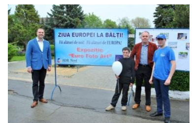
Expoziție de fotografii de Ziua Europei la Bălți

Bălți, 10 mai 2014. Agenția de Dezvoltare Regională Nord (ADR Nord) și Centrul „Pro-Europa” Bălți au organizat o expoziție de fotografii cu genericul „Fii alături de noi! Fii alături de EUROPA!”, precum și un concurs de desene pe asfalt pentru copii.