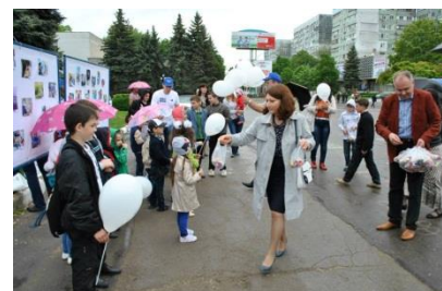
Expoziție de fotografii cu genericul „Fii alături de noi! Fii alături de EUROPA!”

✚ În data de 10 mai 2014, Bălți, Agenția de Dezvoltare Regională Nord și Centrul „Pro-Europa” Bălți au organizat Ziua Europei , cu desfășurarea expoziției de fotografii cu genericul „ Fii alături de noi! Fii alături de EUROPA! ”, precum și a concursului de desene pe asfalt pentru copii. La concursul de desene pe asfalt au participat copii de la grădinițe și elevi, însoțiți de părinți. La final copiii au fost premiați de către reprezentanții Centrului „Pro-Europa” Bălți.