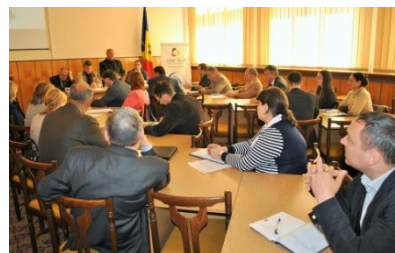
Ședința GLR pentru planificare regională 2020 (08.05.2014)

Procesul de elaborare a Strategiei de dezvoltare socio-economică 2016- 2020, inițiat de ADR Nord în anul 2013, a continuat și în a.2014. Activitățile generale fiind orientate spre stabilirea în comun cu MDRC și ADR-urile din RM a planului de acțiuni, modelului și metodologiei de elaborare a politicilor de dezvoltare regională pînă în a.2020.