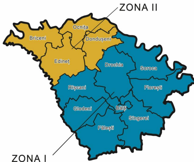
Zonele de MDS în RDN

Obiectivul general: Îmbunătățirea serviciilor publice locale de gestionare a deșeurilor în Regiunea de Dezvoltare Nord (RDN), trecînd etapizat la noile standarde în conformitate cu cerințele Directivelor UE.